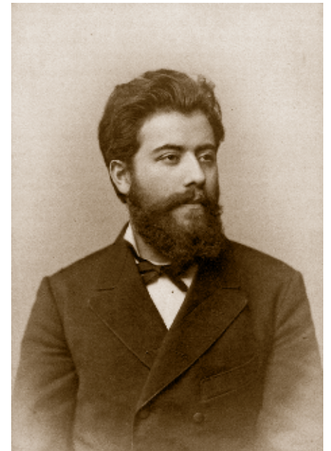
Gustav Mahler, oko 1883.

Theodor W. Adorno, iz Bečkog govora, prvi put objavljenog u Neue Zürcher Zeitung , u povodu 100. godišnjice Mahlerova rođenja.