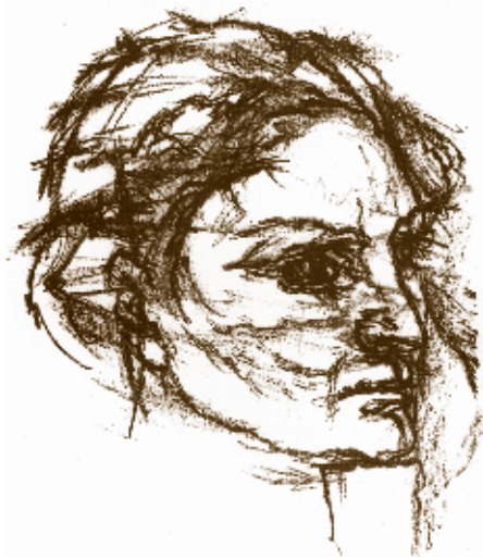
Oskar Kokoschka: Alma Mahler, litografija, 1913.