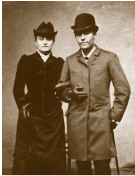
Justina i Gustav Mahler, oko 1890. g.

Šta ćeš mi javiti o Almi! Od nje sam jučer primio vrlo drago pismo koje me oslobađa svih sumnji u toplinu njezina srca i uspravnost duha. Mislim da je tu sve u redu. No, ima li čovjek koji se sprema ostarjeti pravo toliku mladost i životnu svježinu prisiliti da se veže uz njegovu prezrelost – proljeće uz jesen, preskačući ljeto – to je ono što me brine. Znam, donosim mnogo – ali pravo mladosti ne da se ničim iskupiti – i ako bi danas ustali Beethoven, Wagner i Goethe, mlado će srce pred njima klečati i moliti ali – ali, pupati, cvasti može cvijeće samo ususret proljeću – to je za mene veliko pitanje! Neko je vrijeme, dakako, još sve sigurno. Ali što kada moja plodovima bremenita jesen bude ustupila mjesto zimi? Možeš li to razumjeti?