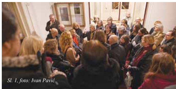
Sl. 1, foto: Ivan Pavić