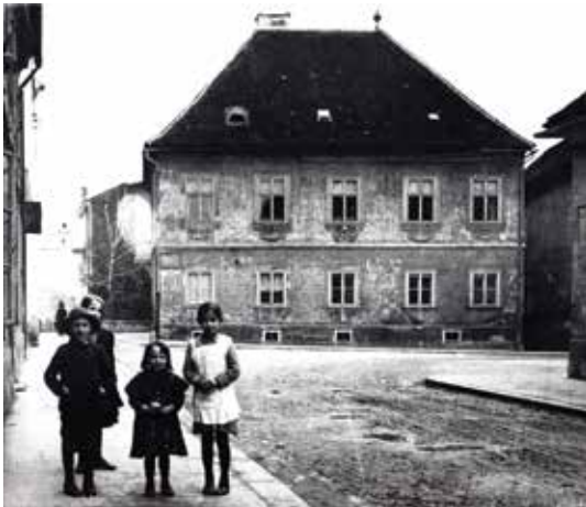
Pogled na prvo sjedište HGZ-a, Markovićev trg 2.