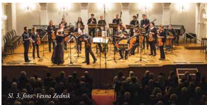
Sl. 3