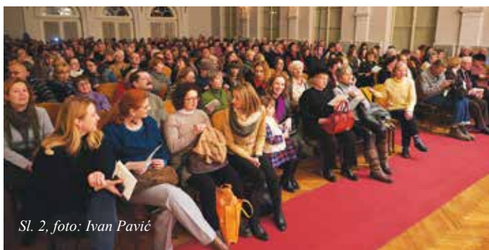
Sl. 2, foto: Ivan Pavić