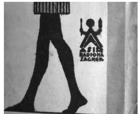
Asir radionica Zagreb