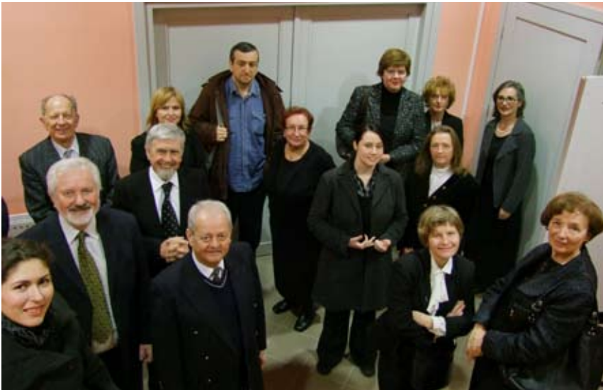
Članovi Društvenog orkestra prije izlaska na podij.