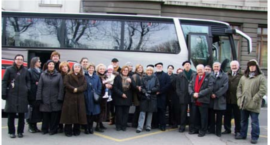
Tradicionalno fotografiranje prije polaska.