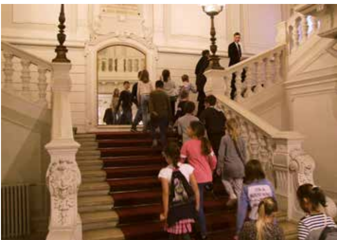
Djeca iz zagrebačkih vrtića po prvi put u HGZ-u.

Drago nam je da možemo najaviti nastavak projekta: u petak, 17. studenog prijepodne ponovno ćemo moći slušati i gledati pu-stolovine simpatičnog slonića Babara.