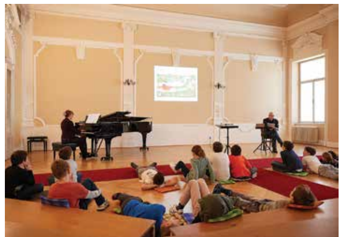
Slikovnica se gleda i sluša ležerno, na podu ili klupi.