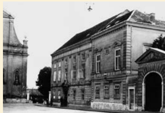
Zgrada Gornjogradske gimnazije u kojoj je 16. II. 1829. počela djelovati glazbena škola HGZ-a