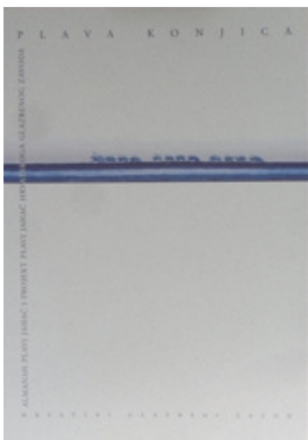
Zbornik Plava konjica , 2009.

Izdanja se mogu kupiti u radno vrijeme blagajne HGZ-a.