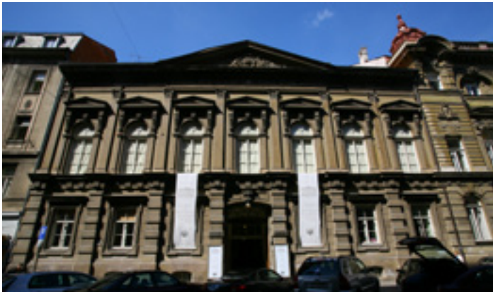
Zgrada HGZ-a u Gundulićevoj 6a, izgrađena 1876. godine.

Godine 1876. HGZ je izgradio svoju zgradu s prvom zagrebačkom koncertnom dvoranom u Zagrebu, poznatoj po iznimnoj akustičnosti. Dvadesetak godina kasnije izgrađena je nova zgrada s Malom dvoranom, u kojoj je desetljećima održavana nastava Muzičke akademije. Obje su zgrade zbog svoje iznimne važnosti proglašene kulturnim dobrom, a od kako je 2015. Muzička akademija iselila u novu zgradu, HGZ ponovno raspolaze svojim prostorom koji pruža brojne mogućnosti. One su već odavno otkrivene – prostori HGZ-a korišteni su za predavanja, kazališne predstave, balove, glazbene seminare i natjecanja, modne revije, sastanke i komemoracije, promocije i okrugle stolove, snimanje filmova i serija (najpoznatije su U registraturi i Kontesa Dora ). No u svemu tome HGZ je prvenstveno ostao hram glazbe, što je njegova osnovna funkcija.