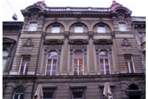
Uz staru zgradu dograđena je nova 1895. godine.